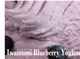
Iwaizumi Blueberry Yoghurt

龍泉洞をモチーフとしたブルーキュラソーのソースと薪窯直煮製法「のだ塩」をまろやかに効かせミルクに練り込んだ爽やかなソルトフレーバー。