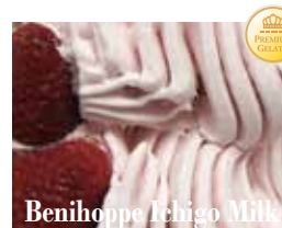
Benihoppe Ichigo Milk

イタリア産の高品質のピスタチオを100%使用。天然な色芳醇で濃厚な風味はまさにプレミアム。