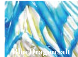
Blue Dragon Salt

田野畑の海水でつくる天然の塩とマダガスカル産ブルボンバニラビーンズを使用。バニラの甘い香りと後味に残る塩の心地がアクセント。