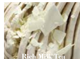
Rich Milk Tea

マンゴーの王様といわれる香り豊かなアルフォンソマンゴーのソルベ。厳選した完熟マンゴーを贅沢に使用