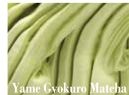
Yame Cyokuro Matcha

桃をまるごと贅沢にすりつぶし甘味と香り、とろみのある桃の魅力を引き立てたさわやかなソルベジェラート。