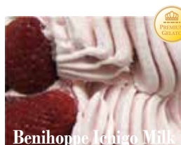
Benihoppe Ichigo Milk

イタリア産の高品質のピスタチオを100%使用。天然な色芳醇で濃厚な風味はまさにプレミアム。