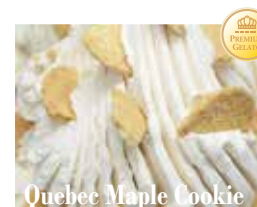
Quebec Maple Cookie

マスカルポーネ風味のジェラートにコーヒーをたっぷり含んだスポンジケーキを織り込んだ2つの食感が楽しめるイタリアンドルチェ。