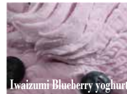
Iwaizumi Blueberry yoghurt

龍泉洞をモチーフとしたブルーキュラソーのソースと薪窯直煮製法「のだ塩」をまるやかに効かせミルクに練り込んだ爽やかなソルトフレーバー。