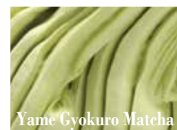
Yame Gyokuro Matcha

桃をまるごと贅沢にすりつぶし甘味と香り、とろみのある桃の魅力を引き立てたさわやかなソルベジェラート。