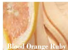
Blood Orange Ruby

マンゴーの王様といわれる香り豊かなアルフォンソマンゴーのソルベ。厳選した完熟マンゴーを贅沢に使用