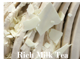
Rich Milk Tea

カカオの濃厚な苦味と控えめ な甘さが絶妙。スッと消える 後味が特徴。さわやかに大 人の味が楽しめるジェラート。