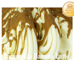
Caramella Banana Latte

国産クーベルチュールのチ ョコレートと香ばしいロー ストアーモンドを贅沢に練 り込んだ王道フレーバー。