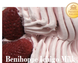
Benihoppe Ichigo Milk

イタリア産の高品質のピスタチオを100%使用。天然な色 芳醇で濃厚な風味はまさにプ レミアム。