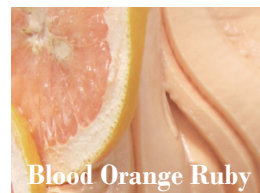
Blood Orange Ruby

マンゴーの王様といわれる 香り豊かなアルフォンソマ ンゴーのソルベ。厳選した 完熟マンゴーを贅沢に使用