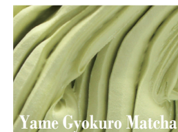
Yame Gyokuro Matcha

桃をまるごと贅沢にすりつぶ し甘味と香り、とろみのある 桃の魅力を引き立てたさわ やかなソルベジェラート。